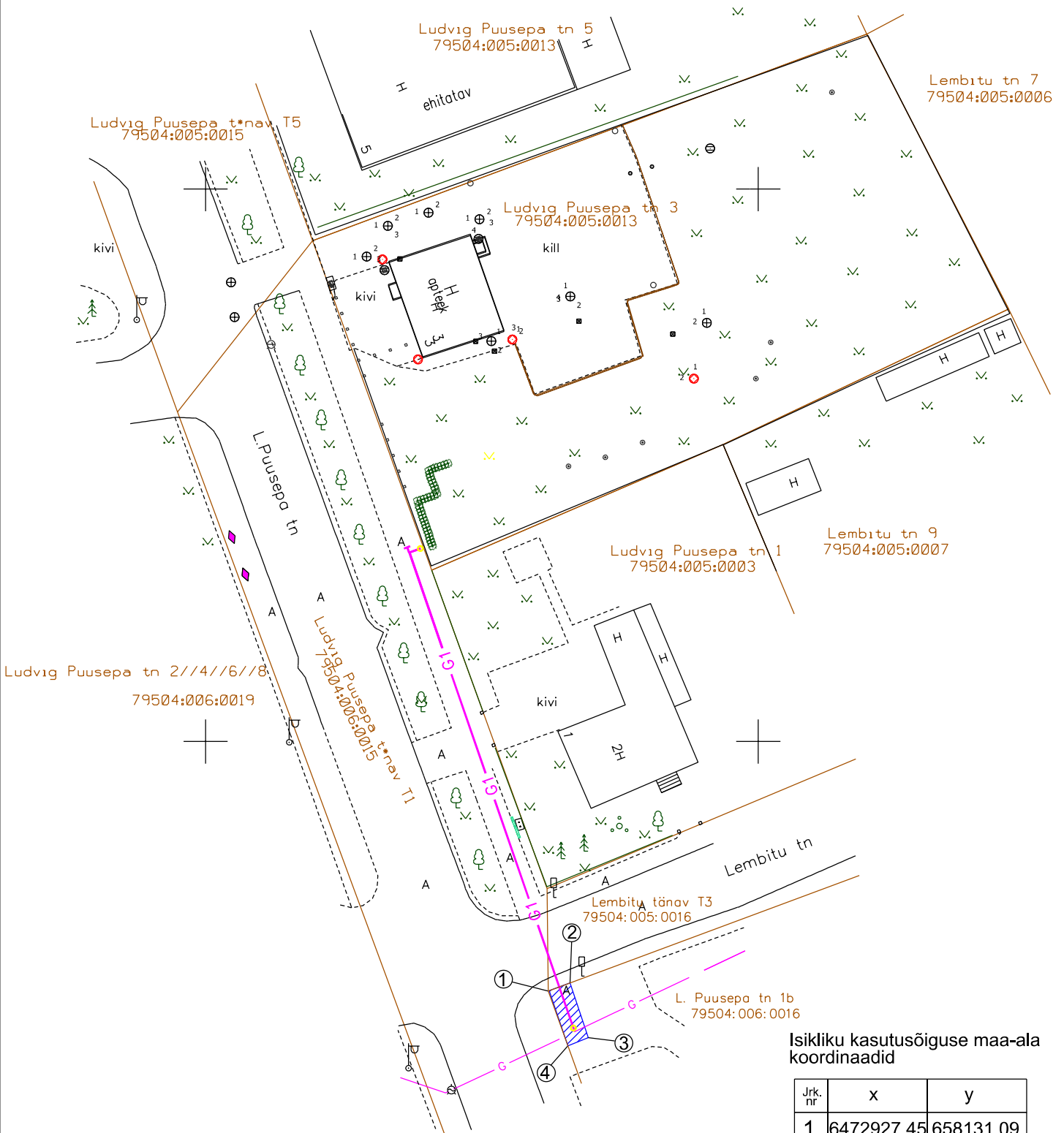
Isikliku kasutusõigusega maa-ala koordinaadid